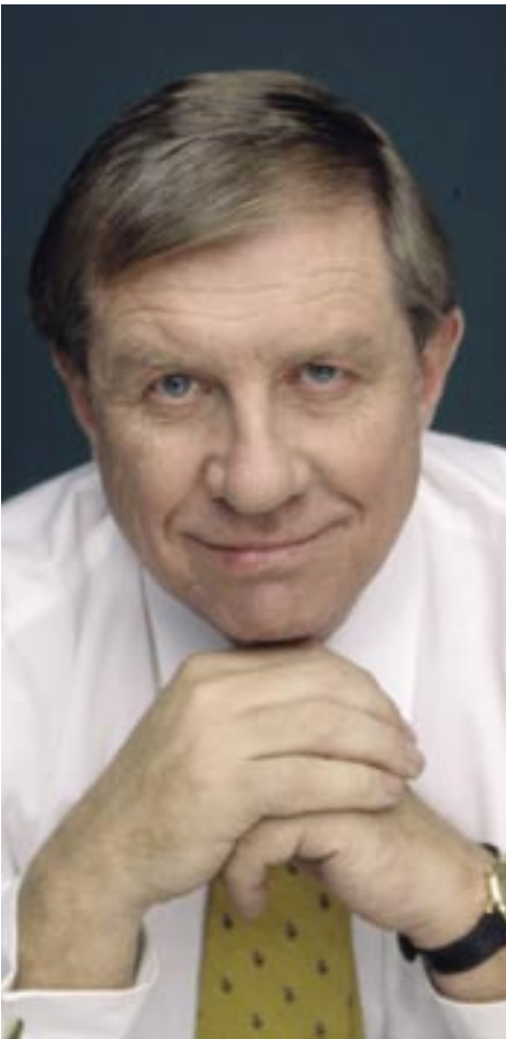
KUVA TALOUSTUTKIMUS OY